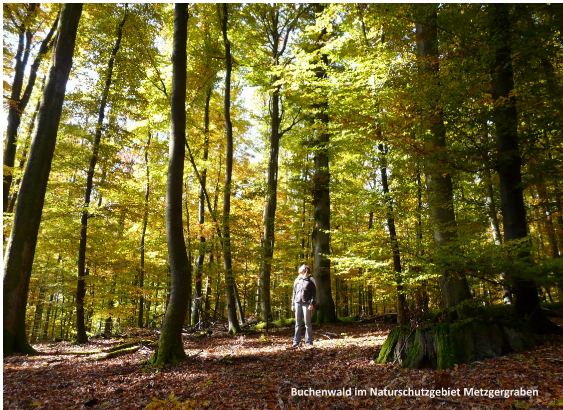
Buchenwald im Naturschutzgebiet Metzgergraben

Ausführliche Informationen und Termine finden sie unter: www.freunde-des-spessarts.de